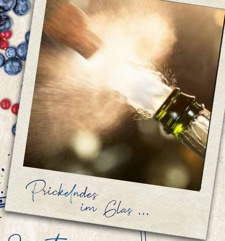
Prickelndes im Glas ...