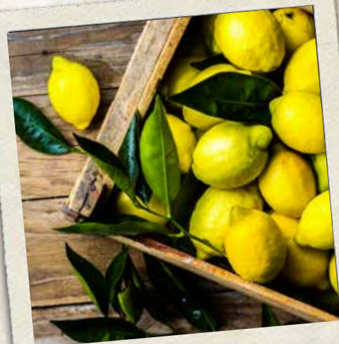
Das schmeckt nach Erfrischung ...

Alle Preise in € inkl. MwSt. Allergene & Zusatzstoffe? Frage nach unserer Allergen- und Zusatzstoffliste oder scanne den QR-Code auf der Rückseite.